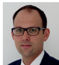
JOOST FASTEN-RATH FDP-Fraktionsvorsitzender

Die aktuelle Haushaltssituation bestärkt die FDP-Fraktion, auf dem richtigen Weg zu sein. Trotz aller Herausforderungen können wir auf eine solide finanzielle Lage in Melsungen bauen. Unterstützen Sie die FDP weiterhin, damit dies so bleibt!